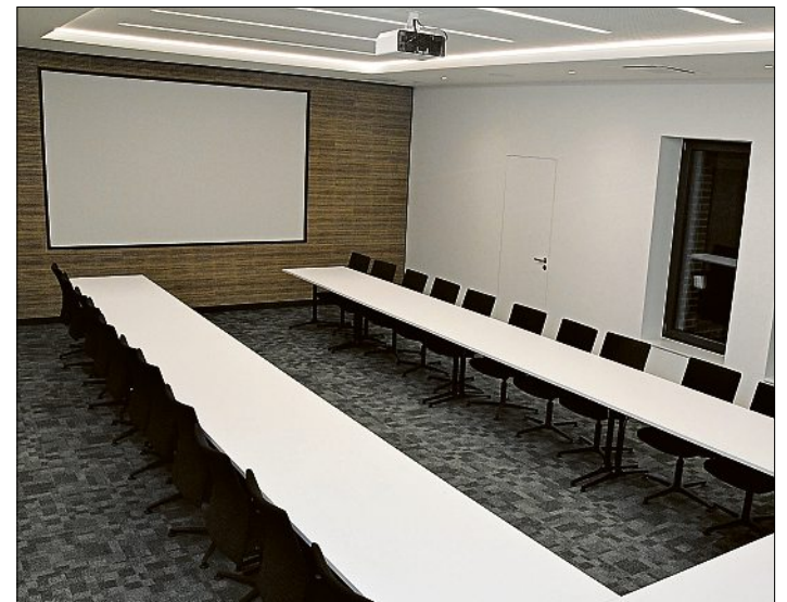
Im Besprechungsraum im Erdgeschoss finden unter anderem die Sitzungen des Betriebsausschusses statt.

unter anderem die Büros und Umkleibereiche für die Werksmitarbeiter untergebracht. Der Bauantrag war im Mai 2020 gestellt worden, im Dezember 2020 folgte der Umzug der Mitarbeiterinnen und Mitarbeiter in Bürocontainer auf dem Werksgelände. Die Bauarbeiten begannen im Januar 2021, ein Teil des alten Bestandsgebäudes wurde damals abgerissen. Weitere Infos über das Wasserwerk unter www.wasserwerk-vechta.de oder auch direkt über den nebenstehenden QR-Code.