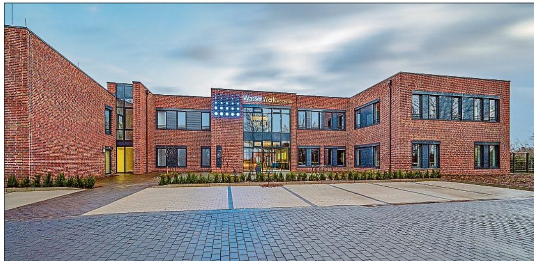
Ein architektonisches Highlight: Das neue Verwaltungsgebäude des Wasserwerks Vechta in Vechta-Holzhausen.

Vechta. (cob) Vor allem die Technik kann sich im Neubau und im sanierten Bestandsgebäude in Holzhausen sehen lassen. Sie wurden beispielsweise mit einer modernen, energieeffizienten LED-Beleuchtung ausgestattet. Über ein Bus-System wird die Gebäudetechnik intelligent miteinander verbunden und automatisiert. So wird die Beleuchtung bedarfsgerecht und abhängig vom Tageslicht gesteuert, ebenso wie die Verschattungen durch Raffstores und die zentrale Temperatursteuerung. Dadurch wird die Energieeffizienz weiter optimiert. Mit dem Ziel, einen Teil des vor Ort benötigten Stroms selbst zu produzieren und zusätzlich in erheblichem Maße CO 2 einzusparen, wurde für das Verwaltungsgebäude eine Photovoltaikanlage mit einer Leistung von 24,6 Kilowattpeak installiert. Zur modernen und effizienten Gebäudetechnik gehören auch intelligente Heizungs-, Lüftungs- und Klimasysteme. Besprechungsräume werden ab einem bestimmten CO 2 -Wert automatisch gelüftet. Die Räume werden über zwei hocheffiziente Wärmepumpen mit einer Fußbodenheizung beheizt. Alle